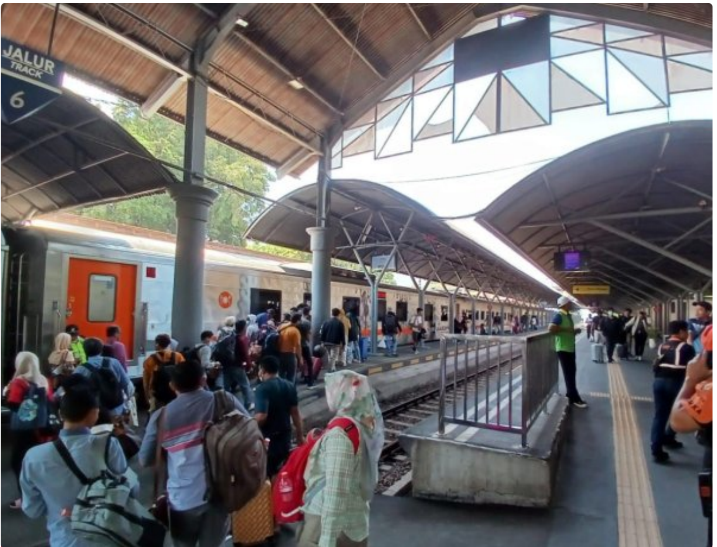
Calon penumpang kereta api

SURABAYA - Pagi ini, Rabu (18/10/2023) penumpang Kereta Api (KA) Argo Semeru yang hendak berangkat dari Stasiun Gubeng Surabaya tujuan Stasiun Jatinegara Jakarta mengalami delay. Jadwal keberangkatan yang semestinya