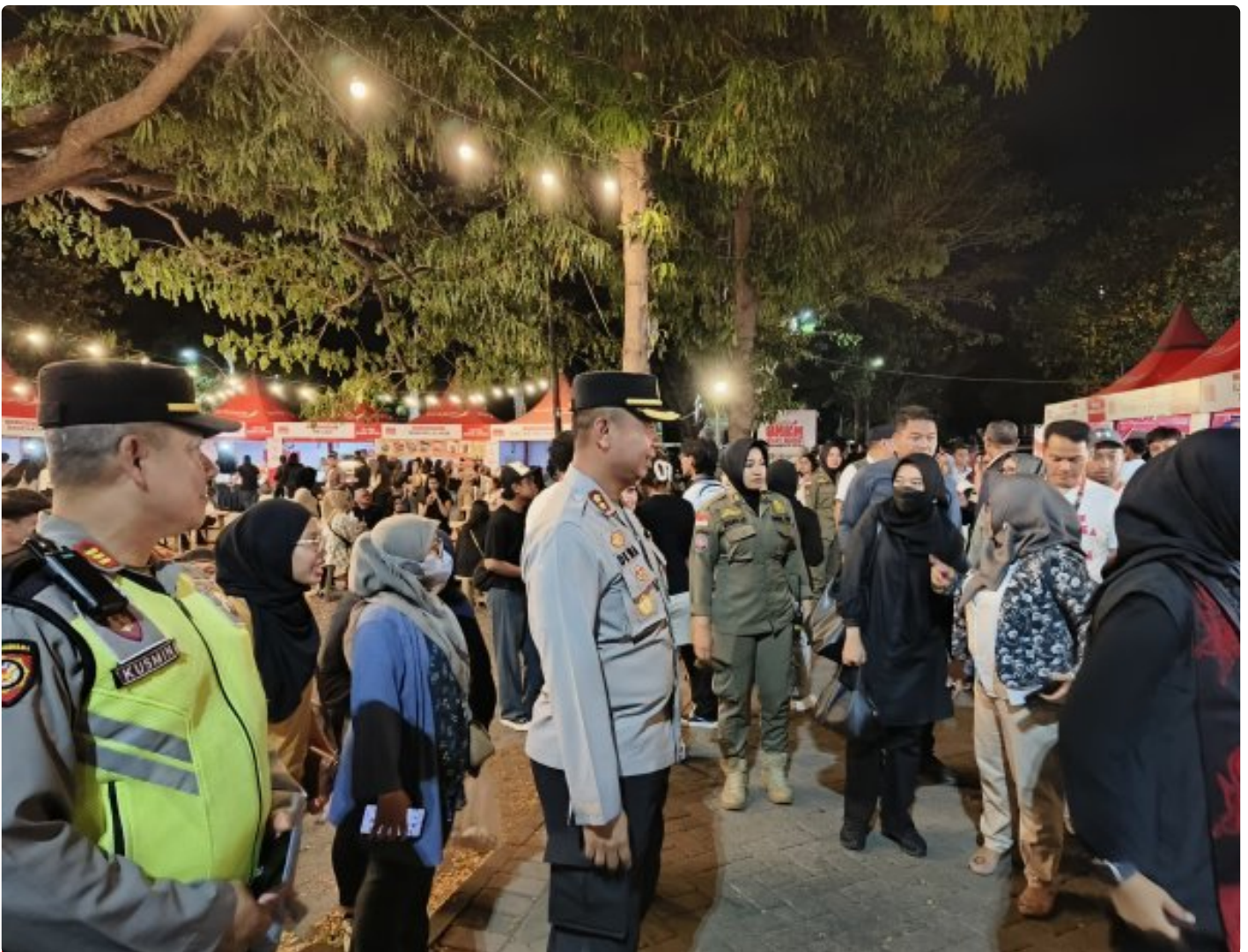
Pengamanan festival musik tepi pantai oleh anggota Polresta Banyuwangi, Senin malam (16/9/2024).

BANYUWANGI - Kepolisian Resor Kota (Polresta) Banyuwangi menggelar pengamanan Festival Musik Tepi Pantai yang digelar oleh Bank Jatim di pantai Boom Marina, Senin (16/9/2024) malam. Apel pengamanan dipimpin langsung